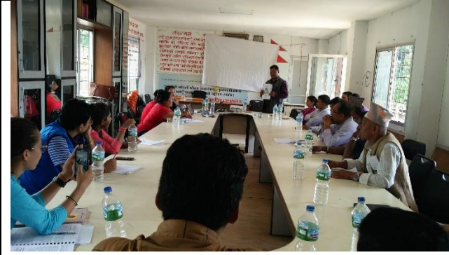
सुभावा संकलन कार्यशालामा गाउँपालिका अध्यक्ष आफ्नो मन्तव्य व्यक्त गर्नुहुँदै