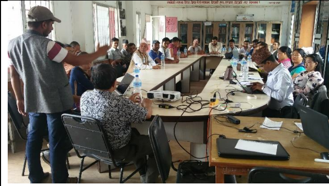
योजना तर्जुमा कार्यशालामा आफ्नो मन्तव्य राख्दै गाउँपालिका कर्मचारी