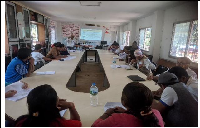
सुभावा संकलन कार्यशालामा मस्यौदा प्रस्तुती