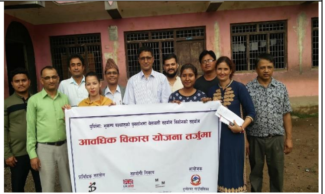
योजना तर्जुमा कार्यशालाका सहभागीको सामुहिक तस्वीर