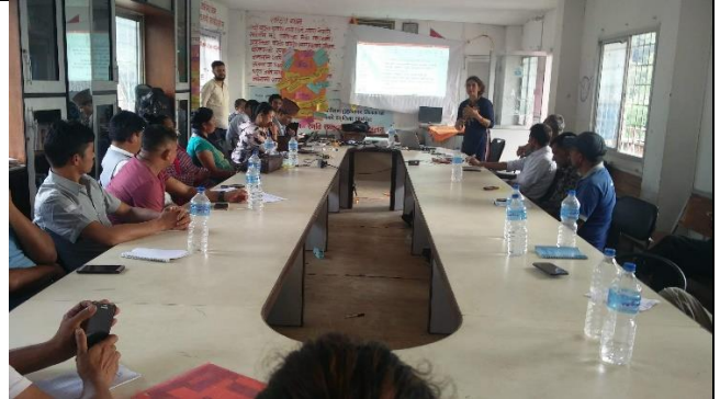
योजना तर्जुमा कार्यशालामा आफ्नो मन्तव्य राख्दै गाउँपालिका उपाध्यक्ष