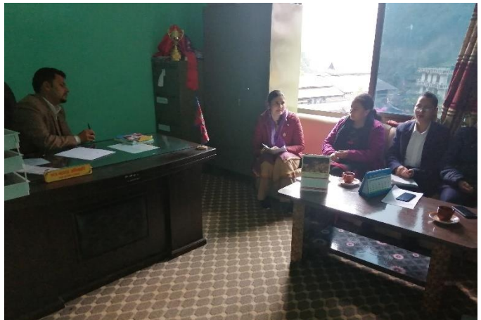
Figure 10: Task Force Formation and orientation on GESI audit procedure