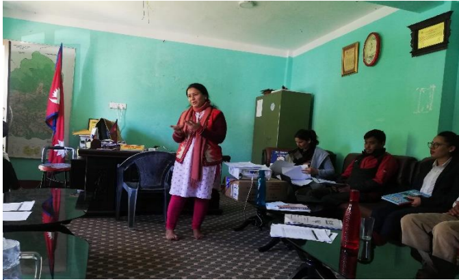
Figure 7: Facilitating GESI Audit Session by