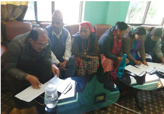
Figure 9: GESI Scoring Exercise