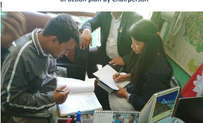
Figure 1: Group work on action plan preparation