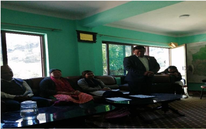
Figure 5: Closing remarks and commitment for the implementation of action plan by Chairperson