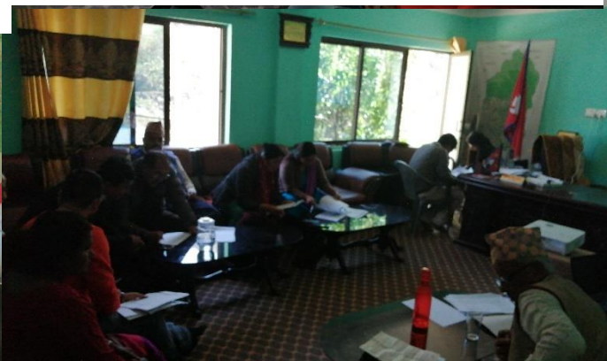
Figure 2: Group Presentation of action plan