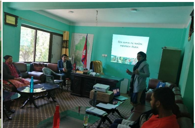
Figure 6: Orientation about GESI Audit by Deputy Chairperson