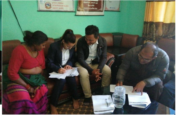
Figure 8: Group Exercise on SWOT analysis