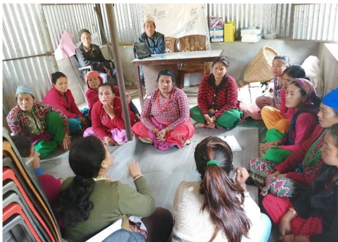
Figure 11: Focus Group Discussion (FGD) with LNOB