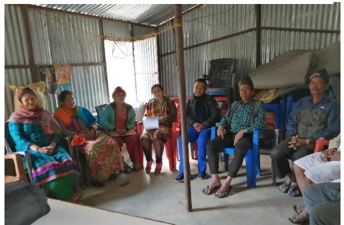
Figure 12: Focus Group Discussion (FGD) with UGC